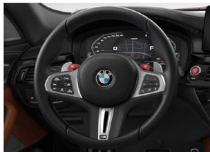
M 多功能真皮方向盤(含換檔撥片)