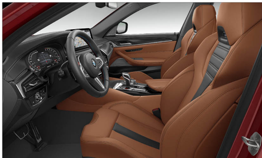
Merino 真皮 / M雙前座跑車電動座椅