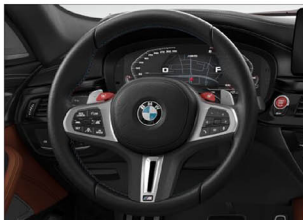
M 多功能真皮方向盤(含換檔撥片)