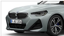
220i M Sport