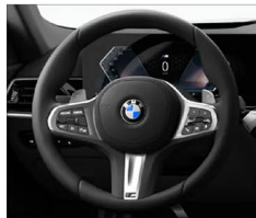
M多功能真皮方向盤 (含換檔撥片)