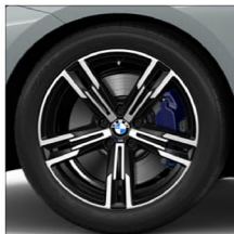
M 雙輻式 848M