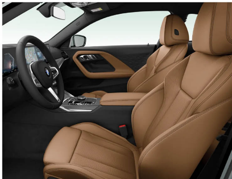
Sensatec 透氣皮質 / 跑車座椅 220i M Sport