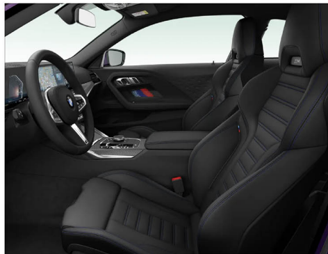
Vernasco 真皮 / M 跑車座椅 M240i xDrive