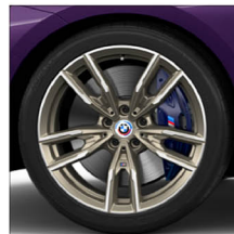
M 雙輻式 792M