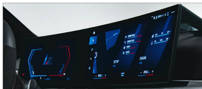
12.3 吋虛擬數位儀錶 / 14.9 吋中控觸控螢幕