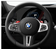
M多功能真皮方向盤搭配專屬縫線 (含換檔撥片)