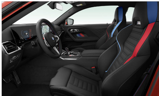
Vernasca 真皮 / M 跑車座椅