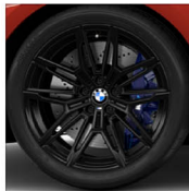
M 雙輻式 930 M