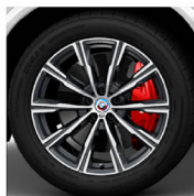
M星輻式 740 M