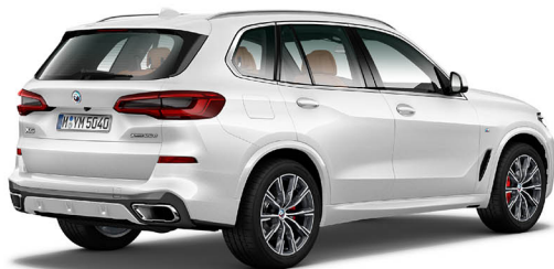
X5 xDrive25d M Sport 鉑金版