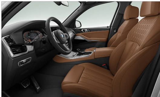
BMW Individual Merino 真皮 / 舒適型座椅